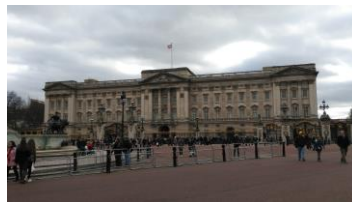
London Eye Buckingham Palace