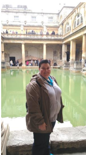
Termas Romanas de Bath