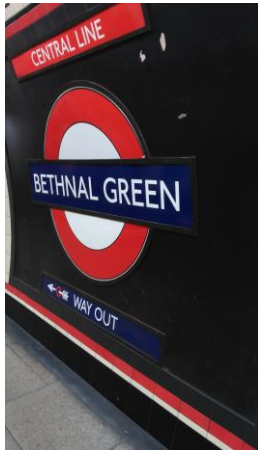
Señalización parada metro

a Dublín que tenía una visita pendiente! Saqué el máximo partido a esta increíble oportunidad. Algún día de compras con las compañeras y acabar en un bar español y la noche nos confundió... Me lo pasé genial!!!