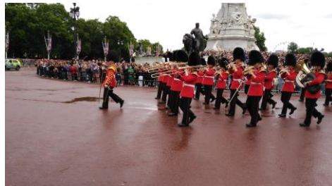
Cambio de la guardia