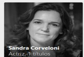
Sandra Corveloni Actriz, 1 títulos