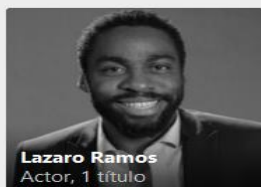
Lazaro Ramos Actor, 1 título