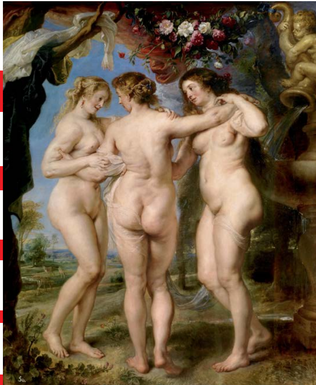
Las tres Gracias. PEDRO PABLO RUBENS. 1630-1635. Óleo sobre tabla de madera de roble. Sala 029.

¿Por qué los cuerpos normativos siguen siendo tan influyentes en nuestra sociedad? En general, la preocupación por el aspecto físico comienza a aparecer en la infancia, pero se intensifica durante la adolescencia. Tenemos que ser realistas y saber que los estándares de belleza establecidos por la sociedad suelen ser muy excluyentes, y pueden causar un gran daño en la autoestima de las personas que no los cumplen (principalmente esta preocupación es mayor en las niñas y mujeres). Las Tres Gracias, por el contrario, representan una belleza natural y diversa. Sus cuerpos no cumplen con los estereotipos (delgadas, altas..), pero eso no las hace menos hermosas. Son mujeres fuertes, seguras de sí mismas y libres de expresarse como quieran.