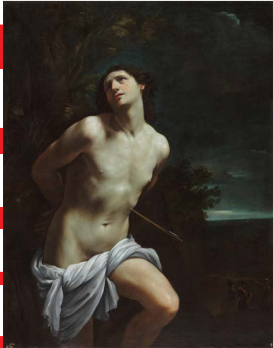
San Sebastián. GUIDO RENI. Hacia 1619. Óleo sobre lienzo. Sala 006.

This painting was painted by Guido Reni, which is one of the five paintings of identical or similar composition attributed to him, in addition, some of his works are in the Louvre Museum, the Dulwich Picture Gallery, the Museum of Art in Ponce and Auckland's Toi o Tamaki Art Gallery.