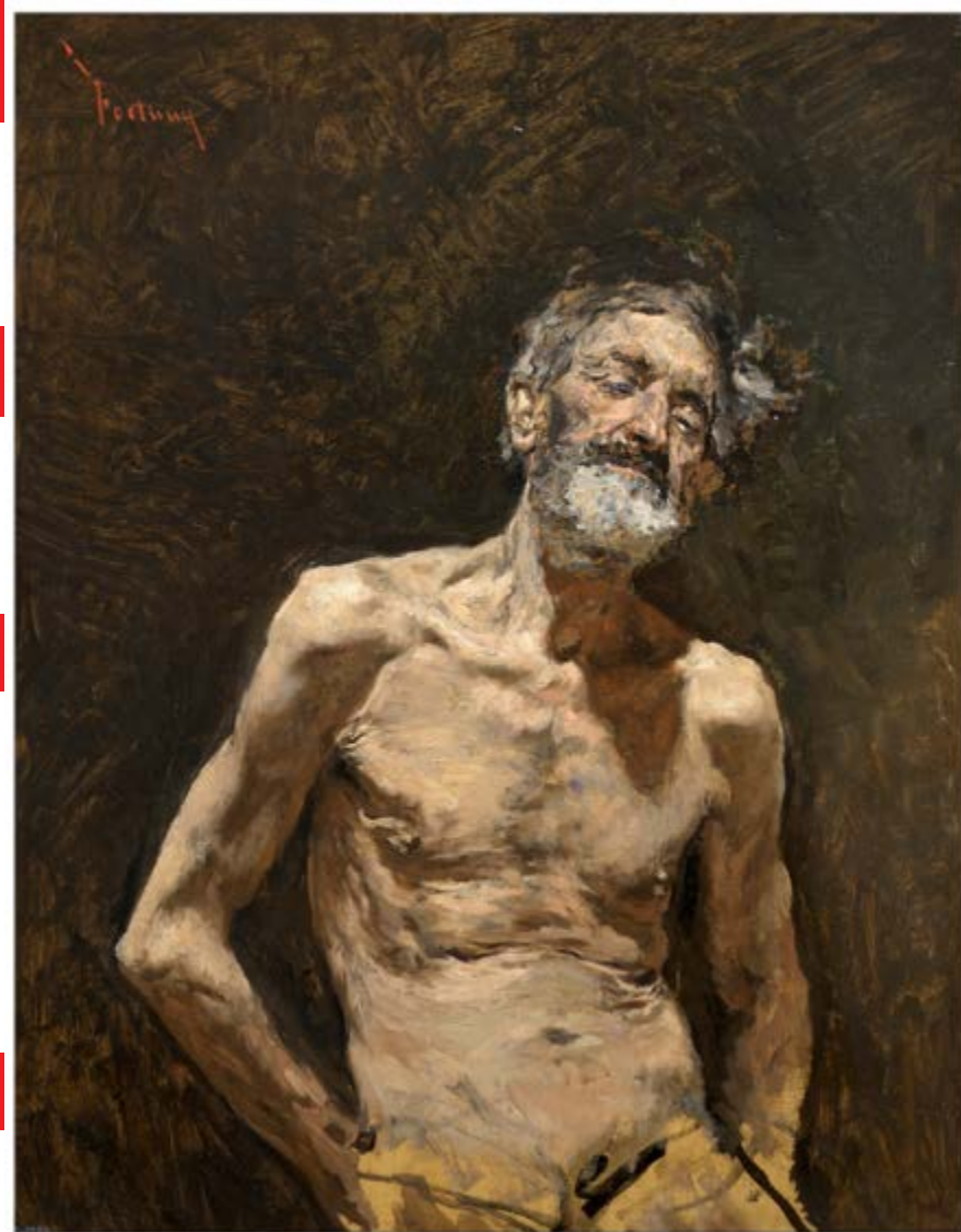
Viejo desnudo al sol. MARIANO FORTUNY Y MARSAL. Hacia 1871. Óleo sobre lienzo. Sala 063B.

Publicamos la segunda entrega de una actividad que realizamos este curso en colaboración con el Museo Nacional del Prado. Pretendemos explorar, a través de algunas obras de la colección, el modo en el que el arte crea y difunde determinados estereotipos sociales y de género.