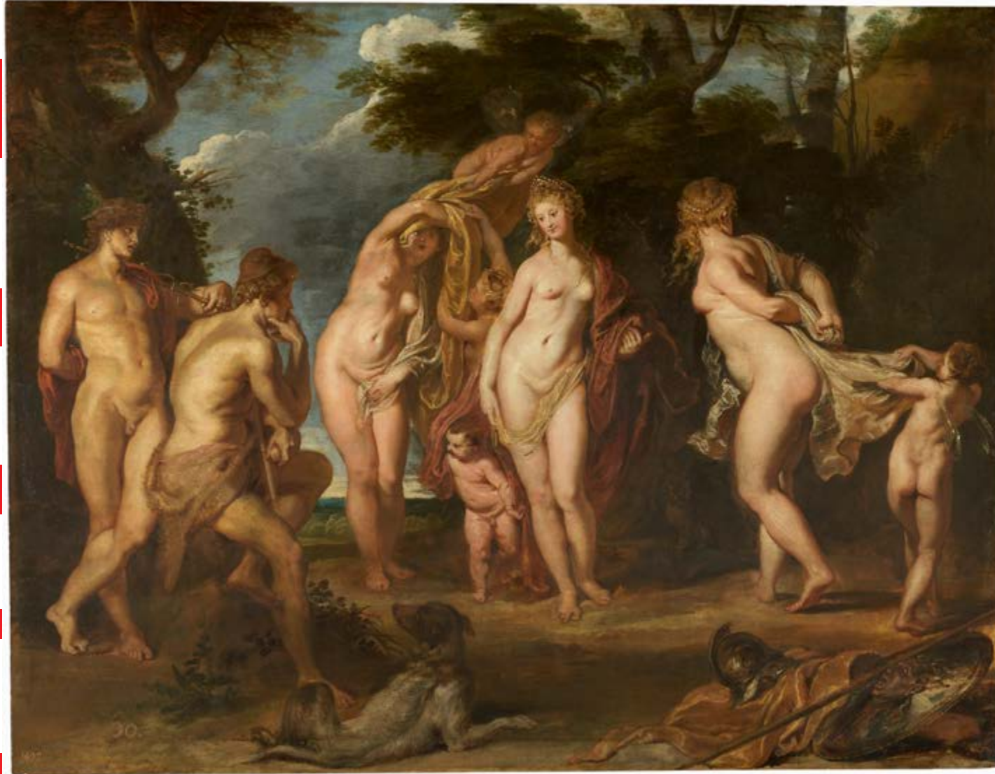
El juicio de Paris. PEDRO PABLO RUBENS. 1606-1608. Óleo sobre tabla. En exposición temporal.