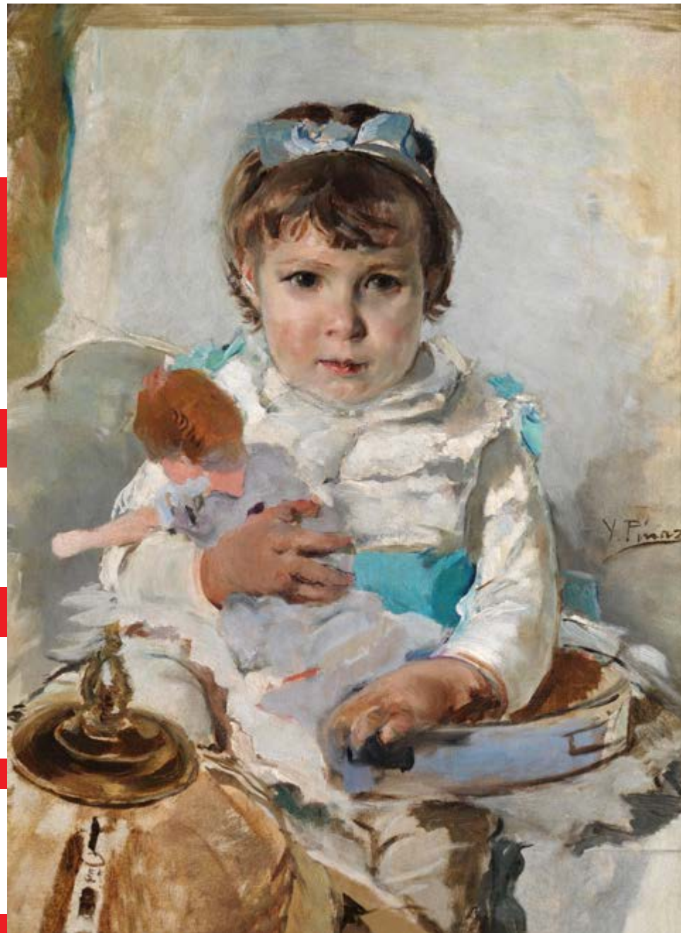
Niña con una muñeca. IGNACIO PINAZO CAMARLENCH. Hacia 1890. Óleo sobre lienzo. No expuesto.