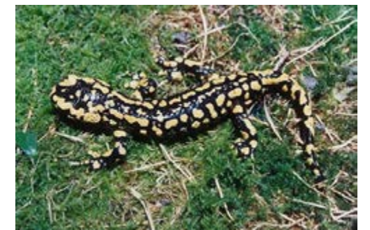
Imagen de una salamandra ( Salamandra salamandra )

El aposematismo o coloración aposemática es una estrategia defensiva utilizada por una gran cantidad de presas para evitar ser atacadas por sus potenciales depredadores. El aposematismo consiste en una coloración fuerte y llamativa con la que muchas especies avisan a sus depredadores de su peligrosidad, tratando de evitar ser atacados. De esta forma, el depredador advierte la posible toxicidad de su presa y decide cambiar su objetivo. Esta coloración tan llamativa, relacionada directamente con la toxicidad, se muestra en una gran diversidad de grupos animales. Entre ellos se encuentran muchas especies de anfibios, tanto anuros (sin cola) como urodelos (con cola). Un ejemplo es la salamandra ( Salamandra salamandra ), especie presente en nuestra región y que, a través de sus fuertes colores negro y amarillo, avisa a sus presas del mal sabor e irritación que le van a causar a consecuencia de las secreciones de sus glándulas.