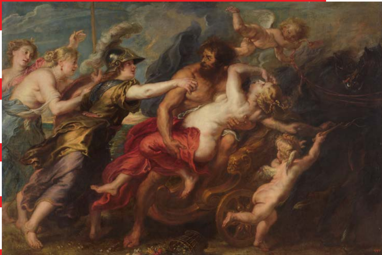
El rapto de Proserpina. PEDRO PABLO RUBENS y taller. 1636-1637. Óleo sobre lienzo. Sala 079.

Esta obra, pintada por Rubens en el siglo XVII, representa el famoso mito romano de El rapto de Proserpina, hija de Júpiter (rey de los dioses) y Ceres (diosa de la agricultura). En él, los romanos contaban cómo, mientras Proserpina recogía flores con unas ninfas, fue raptada por Plutón (dios del infierno y hermano de Júpiter) para llevarla a su trono tras encapricharse de ella. Tras esto, Ceres cayó en una profunda depresión y mientras la buscaba, todos los lugares por los que pasaba se convertían en desierto. Al ver la situación, Júpiter se sintió culpable al no haber hecho nada al respecto y pidió a su hermano que le devolviera a Proserpina. Este no tuvo más remedio que aceptar, pero con la condición de que esta no comiera nada mientras estaba en el inframundo. Cuando su padre fue a su encuentro, en el camino de vuelta a Sicilia, cayó en la tentación de comer seis granadillas del inframundo, lo que provocó que tuviera que volver 6 meses al inframundo todos los años, uno por cada fruto. Es por ello, que cuando Proserpina estaba en el inframundo, las tierras se volvían frías y secas, y cuando volvía, todos los prados volvían a florecer, explicando así el origen de las cuatro estaciones.