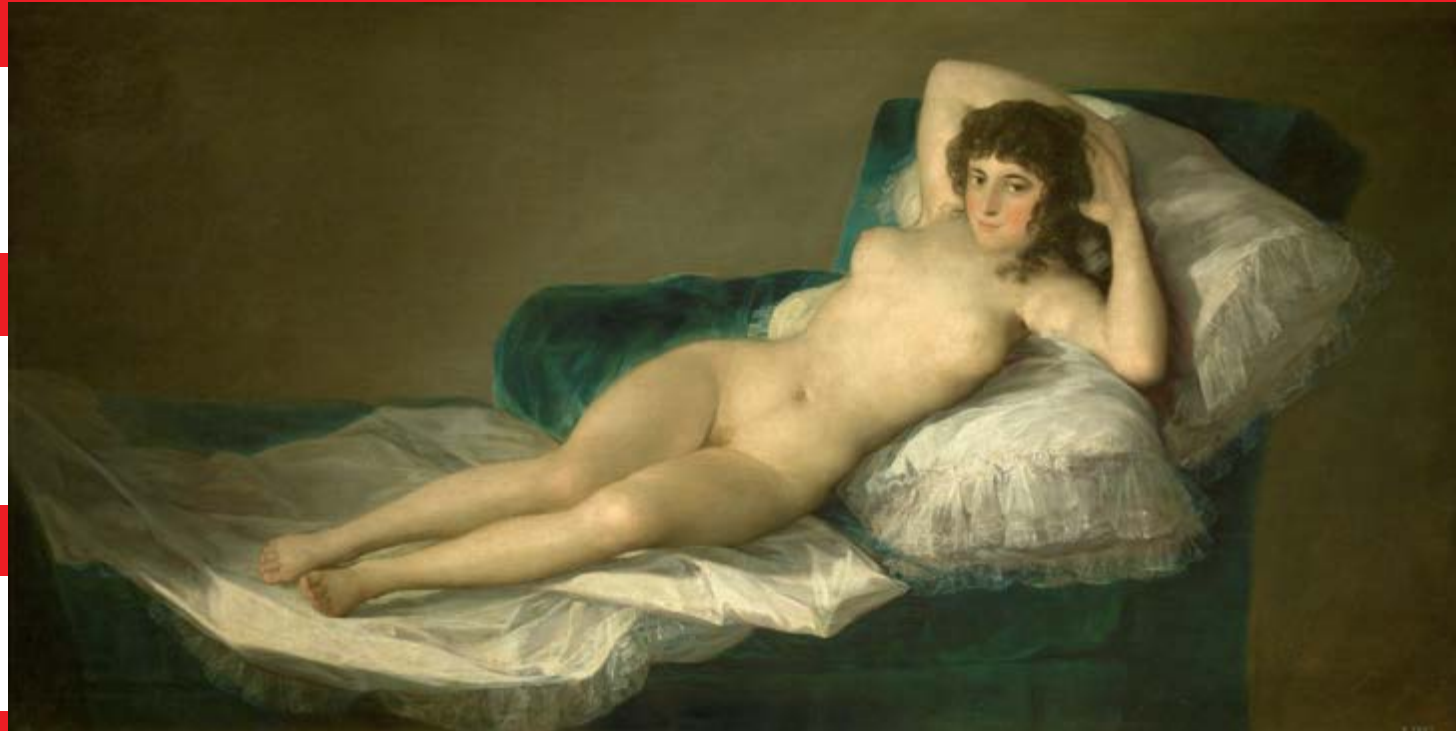
La maja desnuda. FRANCISCO DE GOYA Y LUCIENTES. 1795-1800. Óleo sobre lienzo. Sala 038.