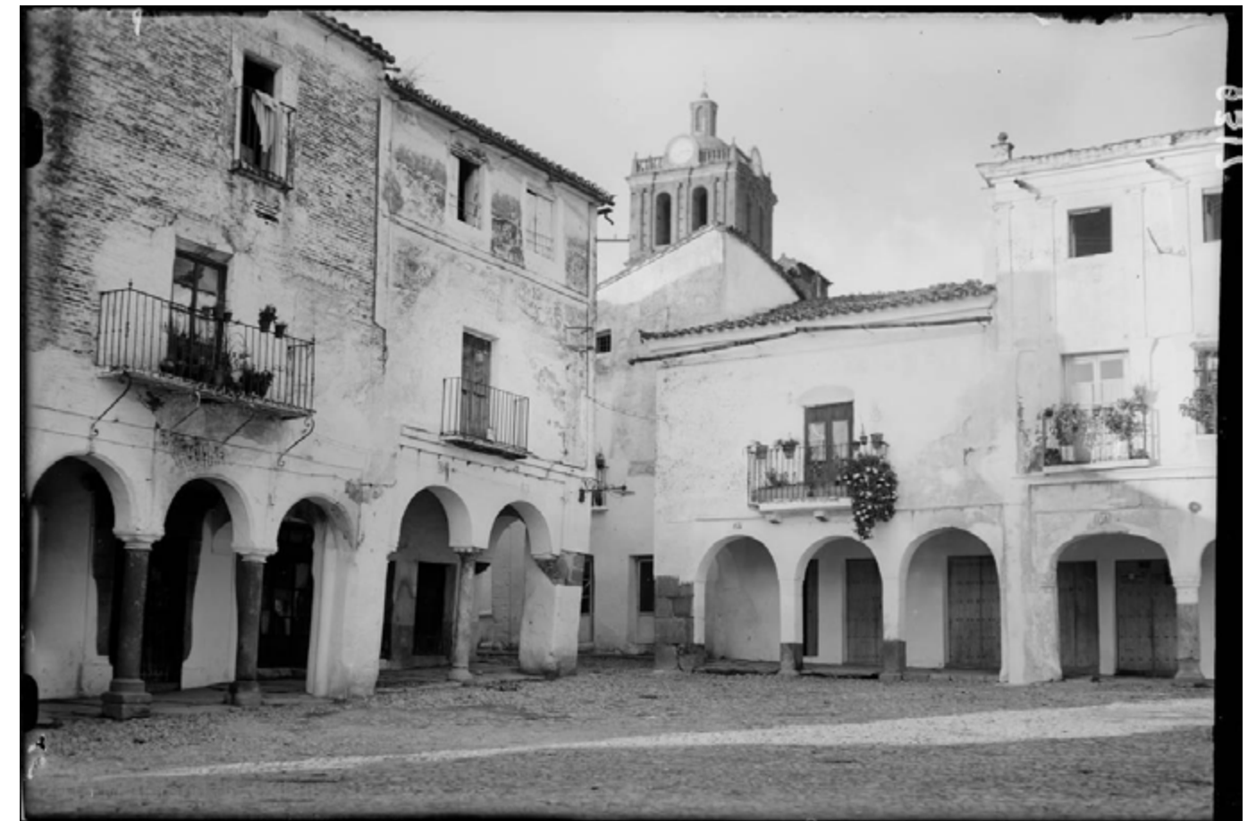
Plaza Chica hacia 1927-1936.

En el plano económico, aunque en Zafra se producían productos como el trigo, la cebada, la avena, las habas o los garbanzos, así como se elaboraban aceite y vino, las manufacturas tenían una presencia importante. Existían doce fábricas de curtidos, un par de fábricas de guantes y otro par de fábricas de sombreros, así como otras de alfarería,