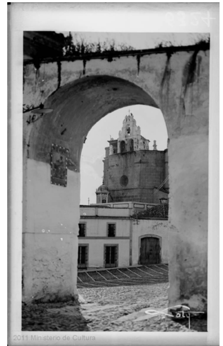
Arco del Cubo y Convento del Corazón de María hacia 1927-1936.