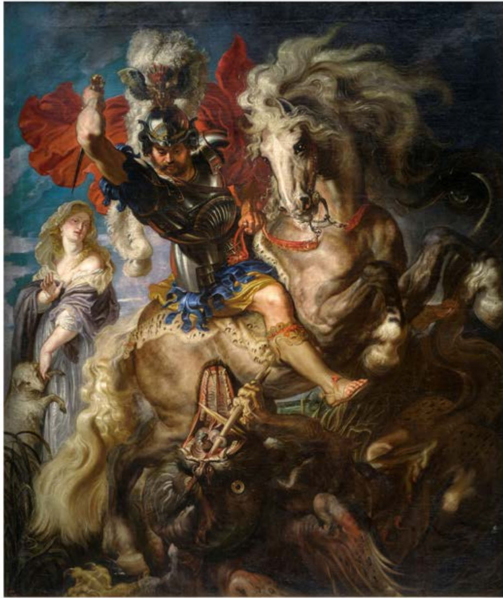
Lucha de San Jorge y el dragón. PEDRO PABLO RUBENS. 1606-1608. Óleo sobre lienzo. Sala 028.

Soy la hija del rey de la ciudad de Silca, en Libia. Os voy a contar mi historia.